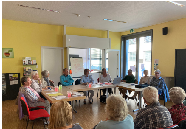
le comité à Assemblée Générale 2023