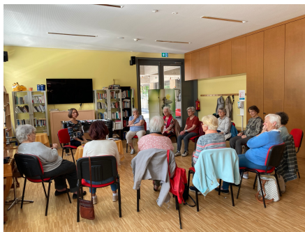
parmi nos activités: méditation randonnées